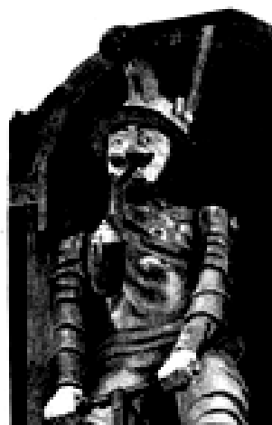
Jacquemard : lithographie d'Alain Ménégon

Un artiste complet peut reproduire ses propres œuvres ou tirer celles préparées par d'autres. Alain nous présentera un court film montrant la technique de la lithographie et, après visite de l'atelier, fera une démonstration de tirage sur sa presse.